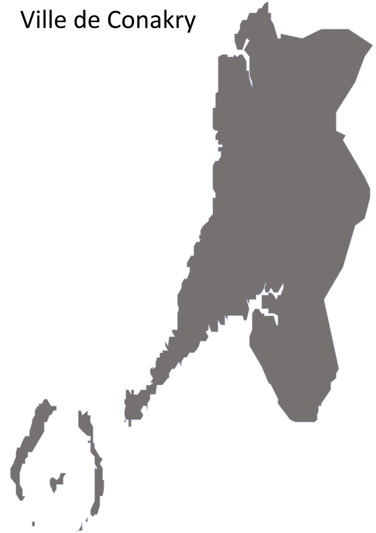
Ville de Conakry